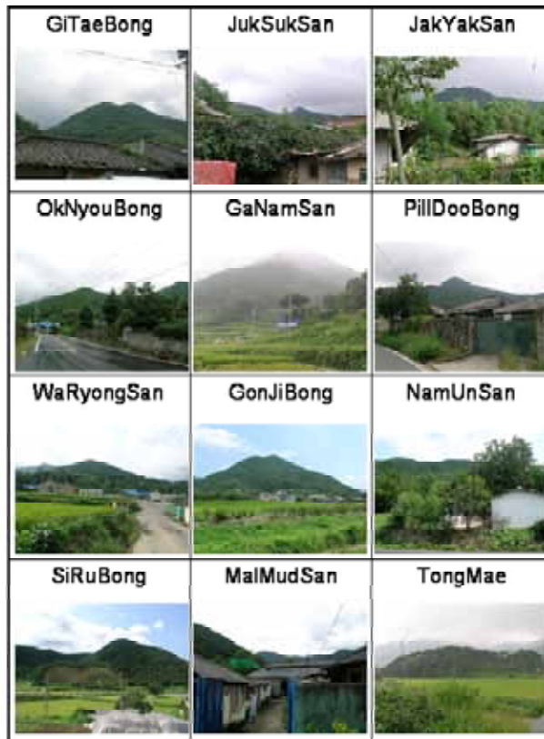
図5 主山・案山一覧（それぞれの集落からの眺め）

14集落の主山・案山を図5に示す（位置は図3参照）。GitaeBong（洛洞、孝大の主山、花村の案山）は旗を掲げた峰の意味である。盆地からも、盆地の向こう側の集落からも見通せる。JukuSuk uSan（酒平、新溪の主山）は石積みの山の意味である。一般に韓国の地層は古く、岩盤が露出する地勢が多い。そうした山の方が