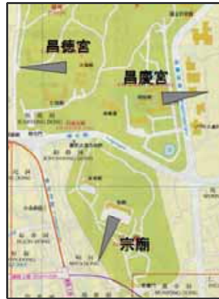
図1 昌徳宮・昌慶宮・宗廟

このことに関する文献は数多いが、古典とも言える「朝鮮の風水」(朝鮮総督府、国書刊行会、1972)が詳しい。これによれば、図2上部の祖宗山から続く山並みが、図下部の朝山に向かって盆地を囲むように続く。盆地の上方に主山がそびえ、盆地の下方には低い案山が位置し、盆地には河川が流れる。このような地形では盆地に生氣が生まれ、主山の麓あたりが居住地として適地となる。この居住適地を表す概念が背山臨水であり、上に述べた昌徳宮、昌慶宮、宗廟も、