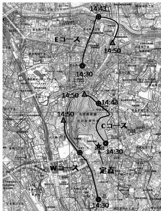
図3 移動観測ルートと時刻

観測は、園の南側市街地から北上して西側の高速道路沿いに移動するWコース、園内を南北に縦断するCコース、園の北側から東側を移動するEコース、および園の南端部近くの樹林内の定点において2秒間隔で自動記録した。観測ルートの一部を図3に示す。