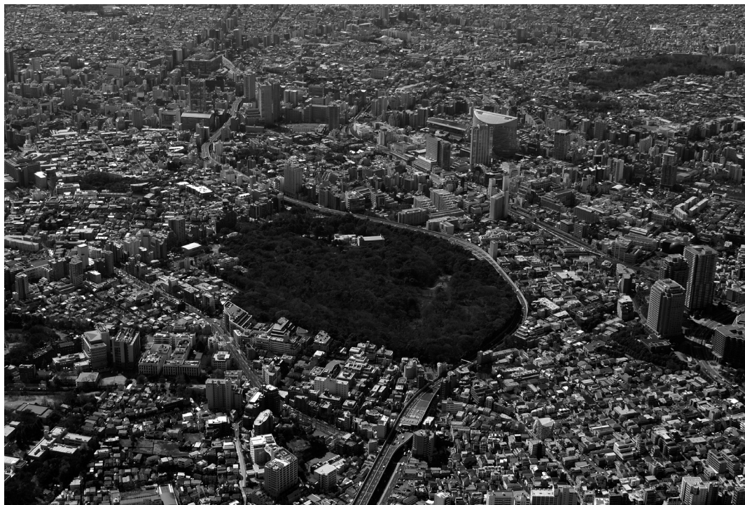
図1 空（北東方向）から見た自然教育園