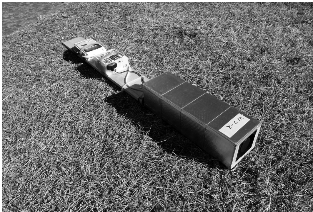
図2 可搬式気温測定記録装置